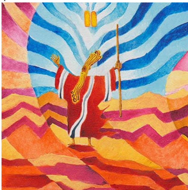
Иллюстрация к главе «Ваэтханан» (Дариус Джилмонт, род. 1963)

Эта глава также включает повторение Десяти заповедей и фрагмент «Шма, Израиль!» («Слушай, Израиль!»), провозглашающий фундаментальные основы еврейской веры: принцип единства Б-га («Слушай, Израиль: Г-сподь – Б-г наш, Г-сподь один!»), заповедь любви к Творцу, повеление изучать Его Тору, а также повязать «эти слова» в виде тфилинов на руку и на голову и начертать их в мезузах, укрепляемых на косяках дверей.